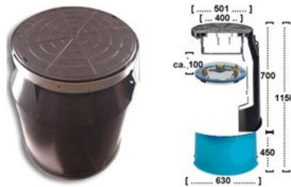
Afbeelding: geïsoleerde water- verdeelput en watermeters met afsluiters

De put is gemaakt van een geïsoleerde HDPE materiaal en heeft een geïsoleerde deksel. De inhoud van de put wordt naar wens van de klant samengesteld en kan bestaan uit een meetstraat met watermeter of alleen afsluiters zoals op onderstaande afbeelding te zien is. Klik op de afbeelding voor meer informatie.