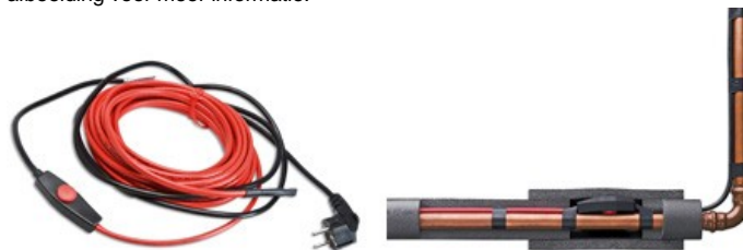
Afbeelding: ThermaLint en ThermaSmart

Door ThermaLint en ThermaSmart leidingisolatie te gebruiken is uw leidingsysteem optimaal beschermt tegen vorst. Het ThermaLint is een volledig automatisch verwarmingslint met ingebouwde thermostaat. ThermaSmart is een isolatiemateriaal, geschikt voor het isoleren van warm en koud water leidingen, koel en luchtbehandelinginstallaties en airconditioning systemen. Klik op de afbeelding voor meer informatie.